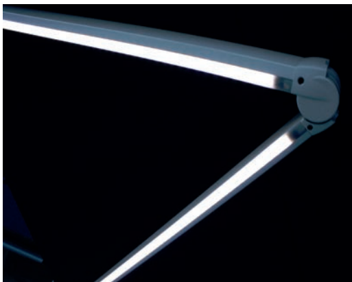
Iluminación LED integrada (opcional)