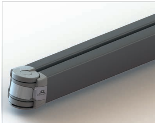
Brazos Concept con cadena de acero Inox