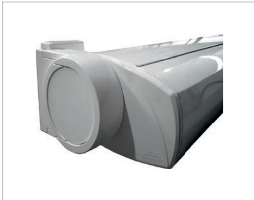
Perfiles en aluminio